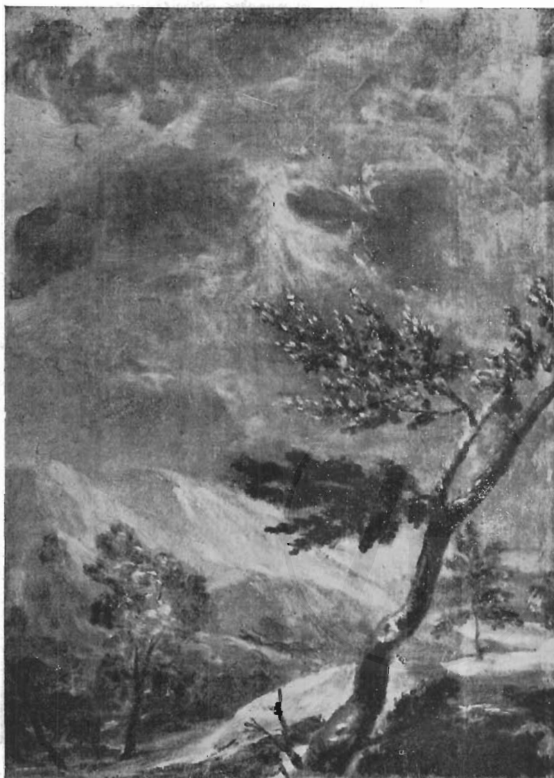
FIG. 4 - NAPOLI, MUSEO NAZIONALE - IL GRECO: particolare del Ritratto di Giulio Clovio.

su uno scheggione rigato qua e là da ruscelli magri e pur stillanti vividi riflessi di luce, si ritaglia il santo nella più spoglia delle vesti fratesche, bilanciato nella sua posa ieratica, memore delle icone bizantine. Lì presso, un fraticello, visto di dorso, si rovescia facendosi schermo della mano all'improvviso balenare della visione miracolosa.