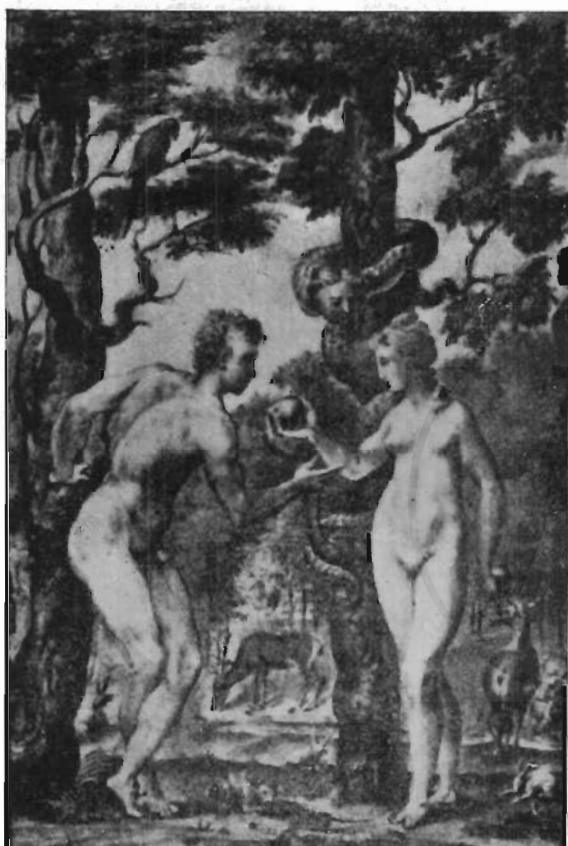
FIG. 2 - NEW YORK, BIBLIOTECA PIERPONT MORGAN - GIULIO CLOVIO: Miniatura.

Al paesaggio mosso e preromantico che si scorge dalla finestra dello studio in cui il miniatore fu dipinto dal Greco, nel bellissimo ritratto del Museo di Napoli (fig. 4), si riferisce, del resto, l'impostazione ambientale di questa scena delle stimmate, quasi