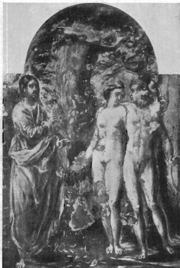
FIG. 3 - MODENA, GALLERIA ESTENSE - IL GRECO: Iddio ammonisce Adamo ed Eva ( particolare di polittico ).

identica al dipinto posseduto da Ignacio Zuloaga, più volte pubblicato, ma anteriore, come ci sembra, a questa opera e di maggiore impegno, se lo stesso Zuloaga (che fu tra i primi ad accorgersi dell'importanza del Greco e del valore delle sue opere) tempestò di lettere, in un certo periodo, i proprietari del dipinto che andiamo illustrando per cercare di averlo per la propria cospicua collezione.