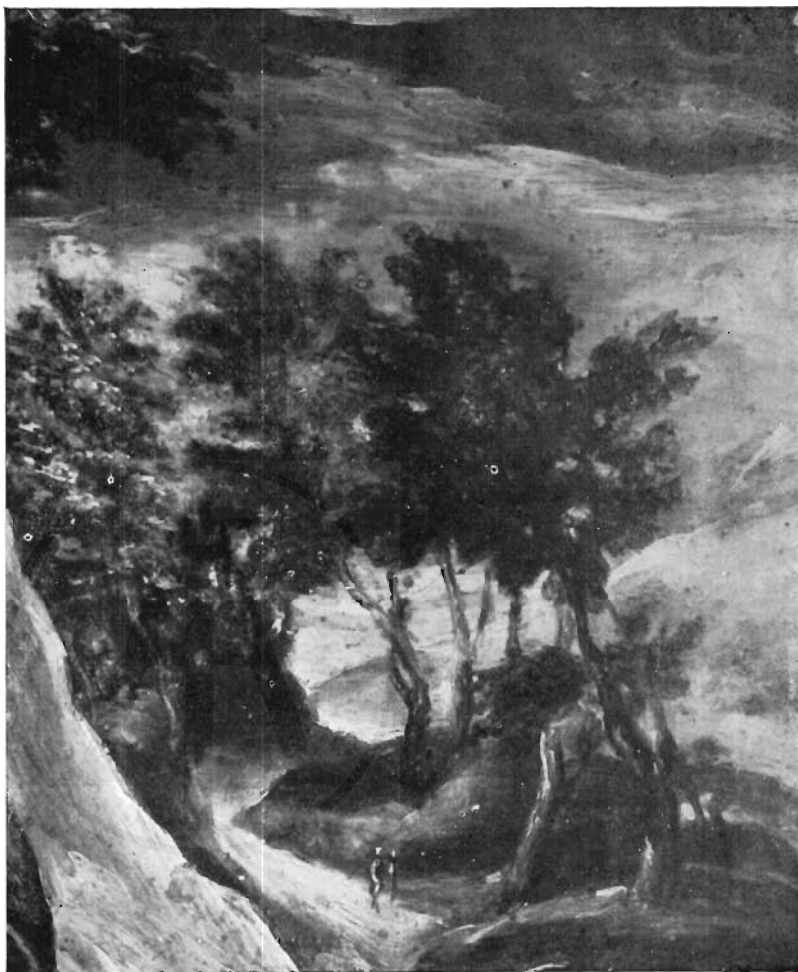
FIG. 5 - NAPOLI, ISTITUTO «SUOR ORSOLA BENINCASA » - IL GRECO: particolare delle Stimate di San Francesco.

zione delle « stimate », dove l'interesse paesistico è così intenso, con l'impressione che l'artista doveva aver subito a Venezia dal « San Pietro Martire » di Tiziano, tutto fruscante di luci e di colori, miracolo di effetti contrastanti quasi da sottobosco, che dovettero insegnare a lungo ai pittori dell'ambiente veneto una nuova interpretazione delle « quinte » di verde in senso commosso e più intensamente vero: e che lo spunto primo possa provenire dal celebre capolavoro, purtroppo tolto alla nostra ammirazione dall'incendio, ce lo conferma quel velario di nuvole che scende tra i rami, che Tiziano aveva in questa sua opera usato per interrompere i tronchi e il fogliame e farvi apparire gli angeli, ma che il Greco spiritualizza in zone delicate e trasparenti, per attenuare la crudezza del profilo arboreo.